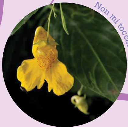
Non mi toccare

Nei boschi umidi, lungo i torrenti, in molte zone d'Italia cresce una pianta chiamata " non mi toccare " che forma piccoli frutti verdognoli, affusolati. Se riesci a trovarne una piantina prova a prendere delicatamente tra le dita uno di questi frutti, che sia ben maturo, e cerca di staccarlo dal suo peduncolo. Sentirai il frutto muoversi tra le tue dita e sarai tentato di aprire la mano e buttarlo via. Che cosa è successo? Il frutto del "non mi toccare" alla minima pressione si stacca dal peduncolo, mentre nello stesso tempo i semi sono lanciati a qualche metro di distanza. Con la pressione delle dita hai rotto il delicato equilibrio tra le forze di tensione, così, il frutto è "scoppiato" e ha spedito lontano i suoi semi.