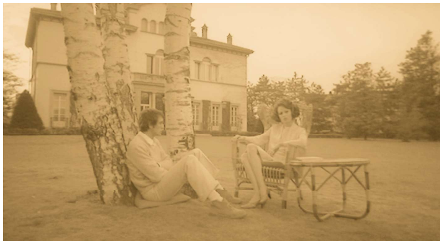
Scena dal film Teorema diretto da Pier Paolo Pasolini (1968).